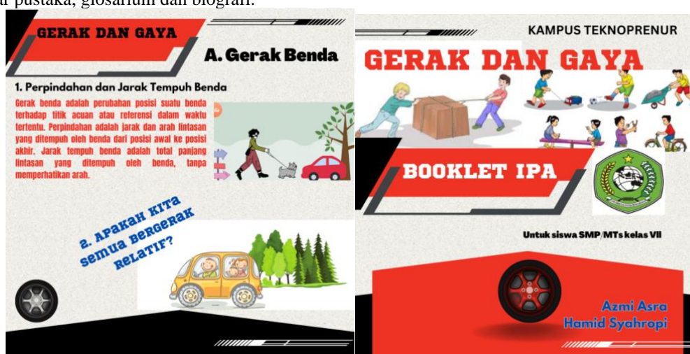
Gambar 1. Gambar Booklet

Hasil penelitian ini diimplementasikan dalam bentuk media booklet, booklet ini berjudul “Booklet IPA ‘Gerak dan Gaya’”. Bentuknya seperti perpaduan antara buku dan leaflet. Booklet didesain menggunakan aplikasi Canva dan dicetak dengan kertas konstruk glowsy 120 g double side dengan ukuran 14,85 x 21 cm, Halaman booklet berisi 50 halaman bolak balik ditambah 2 halaman Cover depan belakang. Komponen yang dimuat pada booklet terdiri dari judul, logo universitas, kata pengantar, daftar isi, pendahuluan, peta konsep, Kompetensi dasar, Indikator, materi Gerak dan Gaya, Evaluasi (Teka-teki silang dan Soal serta Pembahasan), daftar pustaka, glosarium dan biografi.